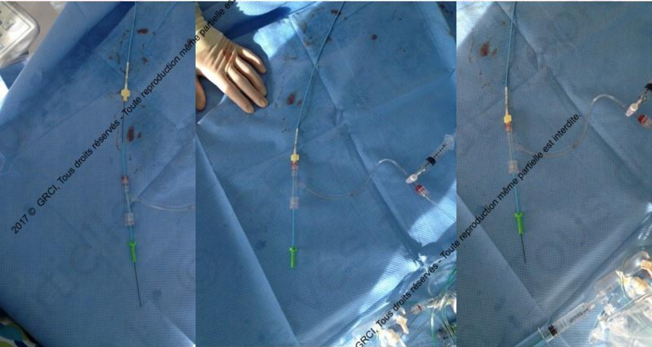
Table et champ opératoire propre